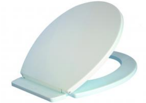
TAPA PLASTICO INODORO UNIVERSAL