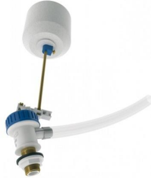
GRIFO FLOTADOR LATERAL CON BOYA