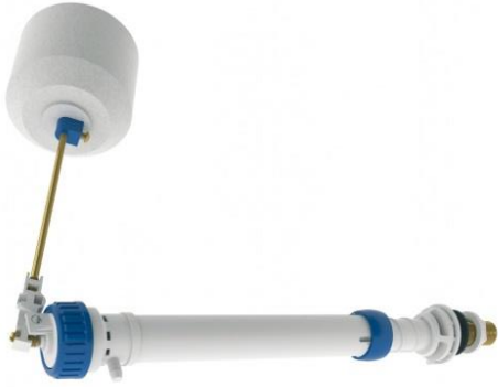
GRIFO FLOTADOR INFERIOR TELESCOPICO CON BOYA